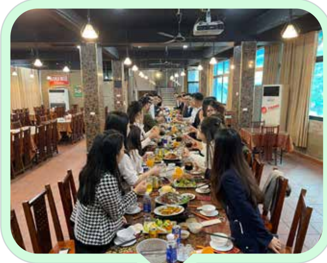
Nâng ly nào anh em ơi!

Đội hình năm nay có nhiều thay đổi so với năm trước. Thứ nhất là liên minh có thêm Cen STDA S3, thứ 2 là đội hình cốt cán năm trước đã nghỉ và thay vào đó là những tân binh mới toe chưa cả biết cách tải app (cười), phải hướng dẫn từng chút một nên bị sai, lỗi khá nhiều. Trong tuần đầu chúng mình đã bị các đối thủ cho “hít khói”. Sau khi họp bàn lại chiến thuật và tự nhắc nhở lại bản thân không được ngủ quên trên chiến thắng. Cả đội đã quyết tâm lấy lại phong độ của đương kim vô địch.