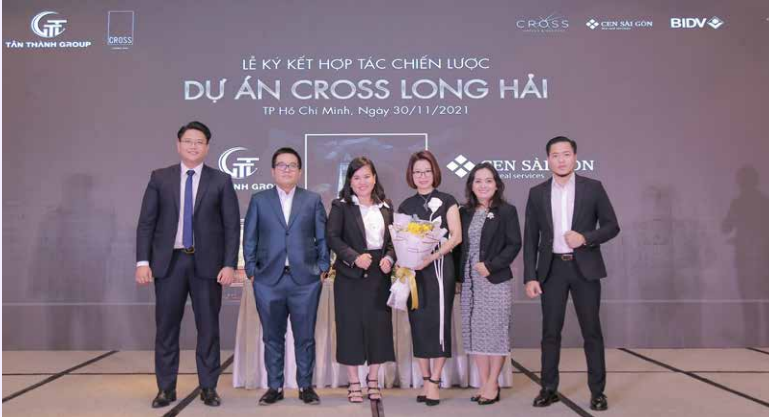
Cen Land ký kết trở thành đơn vị phân phối độc quyền thị trường phía Bắc dự án Cross Long Hải