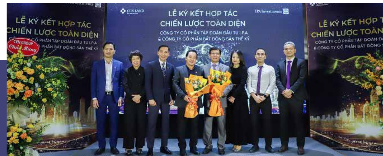
Cen Land và Tập đoàn Đầu tư I.P.A chính thức bước đến một bước phát triển mới, bền chặt và toàn diện hơn