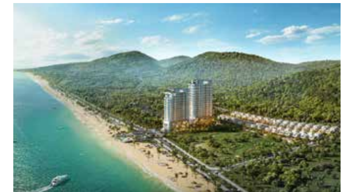
Tổ hợp bất động sản nghỉ dưỡng biển 5 sao Cross Long Hải

Hiện tại, Cross Long Hải áp dụng nhiều chính sách ưu đãi hấp dẫn: chia sẻ doanh thu 35/65, ngân hàng hỗ trợ tài chính đến 70%, 0% lãi suất và ân hạn nợ gốc trong 24 tháng. Đặc biệt, dự án dự kiến bàn giao, đi vào vận hành từ Quý IV/2022 và được bảo chứng chất lượng bởi Đơn vị