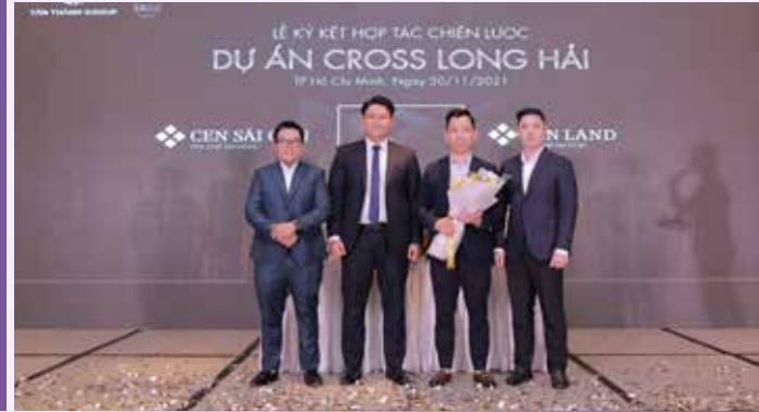
Cen Sài Gòn ký kết hợp tác phát triển kinh doanh dự án Cross Long Hải

Ngày 30/11/2021, tại Sheraton Saigon Hotel (Quận 1, TP.HCM), Cen Sài Gòn ký kết hợp tác chiến lược cùng chủ đầu tư Tân Thành Group, trở thành đơn vị phát triển kinh doanh Tổ hợp bất động sản nghỉ dưỡng biển 5 sao Cross Long Hải. Tại sự kiện, Cen Land cũng tham gia ký kết, trở thành đơn vị phân phối độc quyền thị trường phía Bắc dự án này.