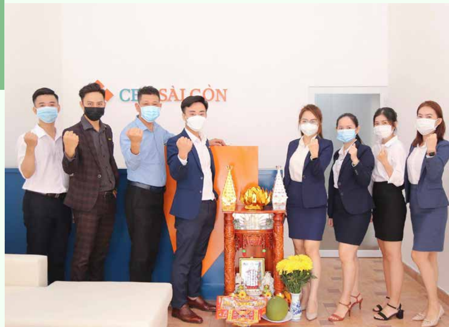
Cen Sài Gòn khai trương văn phòng khu Tây vào tháng 10/2021