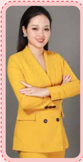
Hãy cố gắng hơn nữa, máu lửa hơn nữa, chắc chắn bạn sẽ thành công!

Vì team mình bán những sản phẩm cao cấp (từ trên 20 tỷ đến 70 tỷ) nên khách hàng phải đến tận nơi để cảm nhận dự án thì mới mua, chứ không chốt online. Do đó, team bắt buộc phải dẫn khách hàng xuống dự án. Lúc đó tất cả anh em trong đội đều quyết tâm cố gắng chăm khách bằng mọi cách, thậm chí đã thông chốt kiểm dịch để đưa khách hàng tới tận dự án. Điều này thực sự khó khăn, có ngày team bị công an bắt 2 lần.