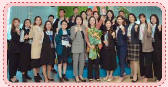
Luôn nỗ lực để đạt được những con số vượt kỳ vọng

Không ngủ quên trong chiến thắng, mình và team vẫn luôn có những mục tiêu rõ ràng để cố gắng đạt kết quả tốt hơn trong thời gian tới.