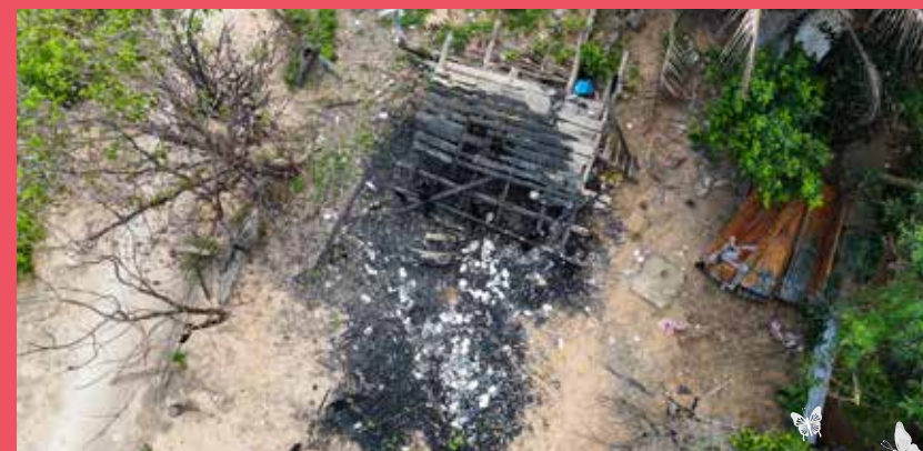
Đám tro tàn sau cơn hỏa hoạn, và ngôi nhà đã được Quỹ Những tấm lòng Nhân ái hỗ trợ xây dựng lại với kinh phí 100 triệu đồng

Và nếu không đặt chân tới tận nơi, bạn cũng chẳng thể tưởng tượng được gương mặt thất thần gia đình bị lửa thiêu cháy rụi ngôi nhà chỉ sau một đêm, ánh mắt rưng rưng, không giấu nổi niềm vui khi Quỹ hỗ trợ xây dựng lại căn nhà.