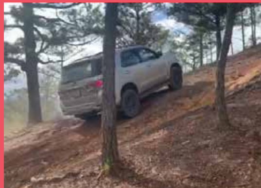
Xe kẹt giữa rừng, trượt trên những con dốc cao khuất tầm nhìn

Hoang mang, sợ hãi khi xe bị kẹt giữa rừng, trượt trên con dốc cao không thấy lối ra.