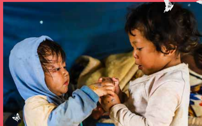
Em bé Tây Nguyên ôm chặt miếng bánh như một món quà quý giá

Bạn có tưởng tượng được cảnh, một gia đình 8 người, 6 đứa con nheo nhóc sống tạm bợ trong căn nhà quây tôn giữa rẫy café, họ không có nổi một chiếc giường để ngủ. Bữa ăn hàng ngày chính là cơm trắng ăn với muối và chút củ cải trắng. 6 đứa trẻ con cứ thế lớn lên như cây cỏ. Chúng hồn nhiên chạy theo khi chúng tôi tới thăm, có đứa nép mình sợ hãi bên cánh cửa cũ mèm sập sập, hay ánh mắt sáng rực khi được chúng tôi tặng cho những phần bánh kẹo – Chúng ăn ngon lành như thể đó là thứ sơn hào hải vị mà chúng chưa từng một lần được thưởng thức trong cuộc đời.